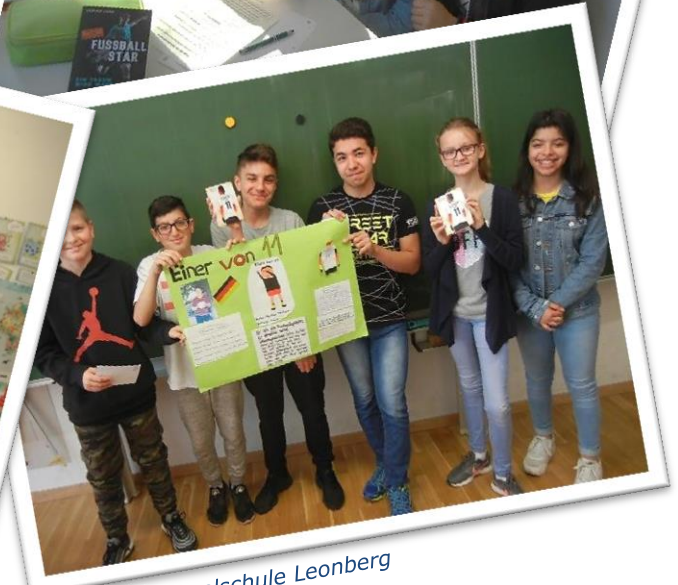
Ostertag Realschule Leonberg